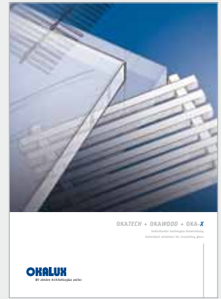
OKATECH + OKAWOOD + OKA X