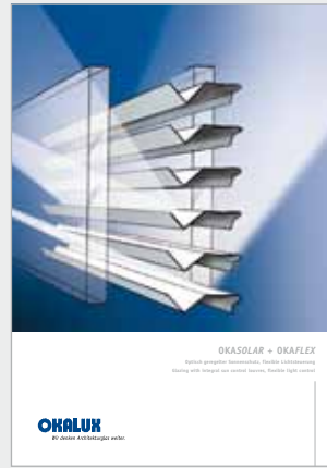
OKASOLAR + OKAFLEX