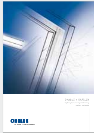
OKALUX + KAPILUX